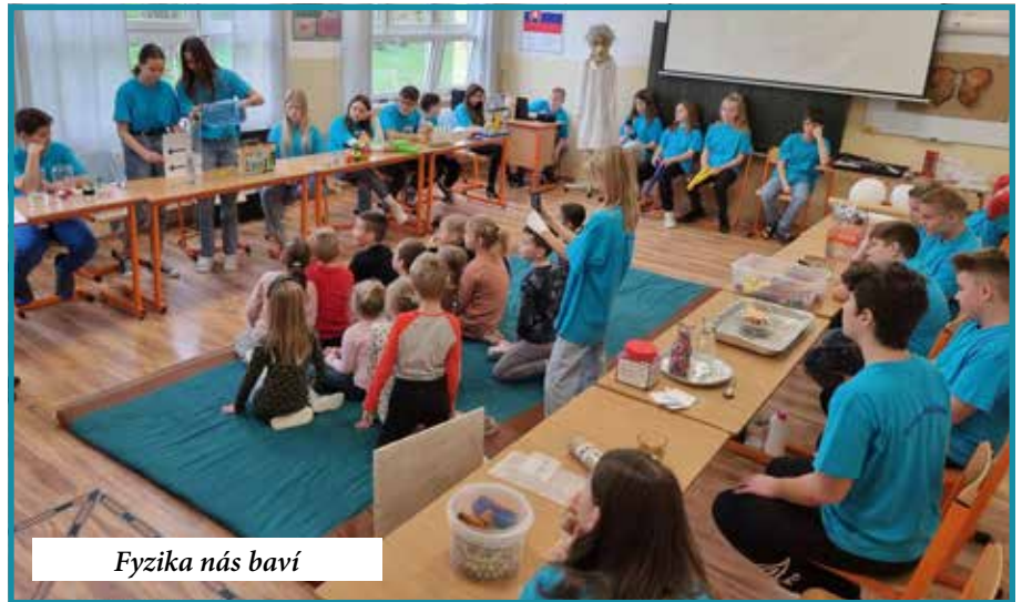
Fyzika nás baví

Pokiaľ však tí starší vedia nielen zabaviť, ale aj naučiť, je táto spolupráca o to cennejšia. Dve krásne akcie sú toho dôkazom.