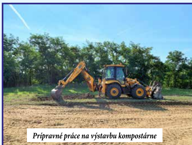
Prípravné práce na výstavbu kompostárne