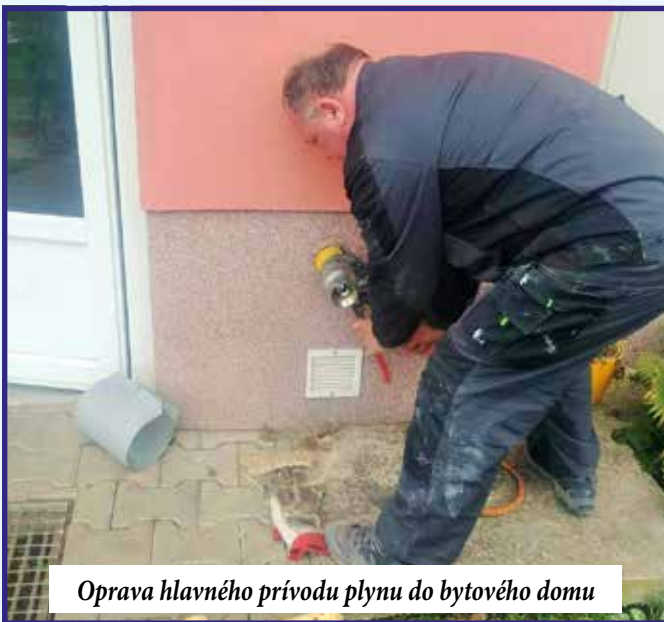
Oprava hlavného prívodu plynu do bytového domu

by sa použili na vybavenie interiéru KD, a to na stoličky, stoly a germicídne žiariče. To, či nám peniaze budú schválené, sa dozvieme v roku 2022.