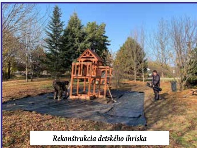
Rekonštrukcia detského ihriska

Zapojenie sa do projektu „Zdravotné stredisko – výstavba zelenej strechy a fasáda“ z MŽP SR, zameranú na Vodozádržné opatrenia v urbanizovanej krajine – Pre zmenu Ministerstvo životného prostredia SR vydalo výzvu na výstavbu zelenej strechy a keďže na zdravotnom stredisku je