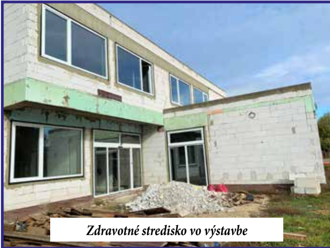
Zdravotné stredisko vo výstavbe

by sa použili na vybavenie interiéru KD, a to na stoličky, stoly a germicídne žiariče. To, či nám peniaze budú schválené, sa dozvieme v roku 2022.